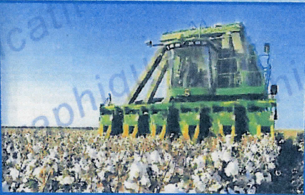
À San Joaquin Valley (Californie), technique moderne de récolte du coton qui permet de travailler sur sept rangs à la fois.