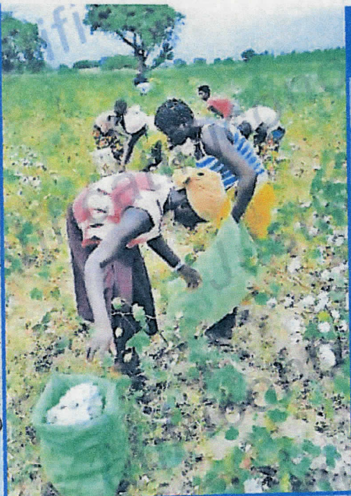
Récolte du coton à la main au Burkina Faso.